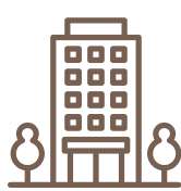
CONDOMINI E ALTRI ENTI DI GESTIONE